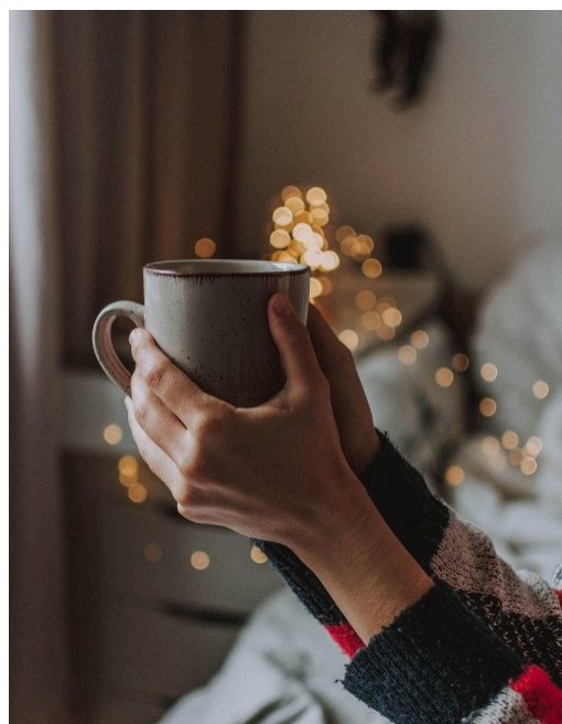
Olet lämpimästi tervetullut tilaisuuteemme 10.12.! Kuva:

PLU ry:n hallinnoima VETO+ hanke kutsuu toimijoita, jotka ovat kiinnostuneita oman organisaationsa maksuttomasta kehittämisestä (esim. rekrytointivalmiuksien, hallintoprosessien tai työnantajana toimimisen osalta) tulemaan paikalle