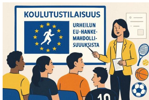
Kuva on tuotettu tekoälyllä.

Uuden valtakunnallisen kyselyn mukaan suomalaiset liikunta- ja urheilutoimijat hyödyntävät EU-rahoitusta yhä varsin vähän, erityisesti tiedon ja henkilöresurssien puutteen vuoksi. Vastauksena haasteeseen liikunnan aluejärjestöt tarjoavat valtakunnallisia, maksuttomia tukitoimia. EU Sport 2.0 -hankkeessa valmistellaan opasta EU-hankehakemusten kirjoittamiseen, ja lisäksi syksyllä 2026 tarjolle tulee koulutuskokonaisuus, joka kattaa hankehakuprosessin keskeiset vaiheet.