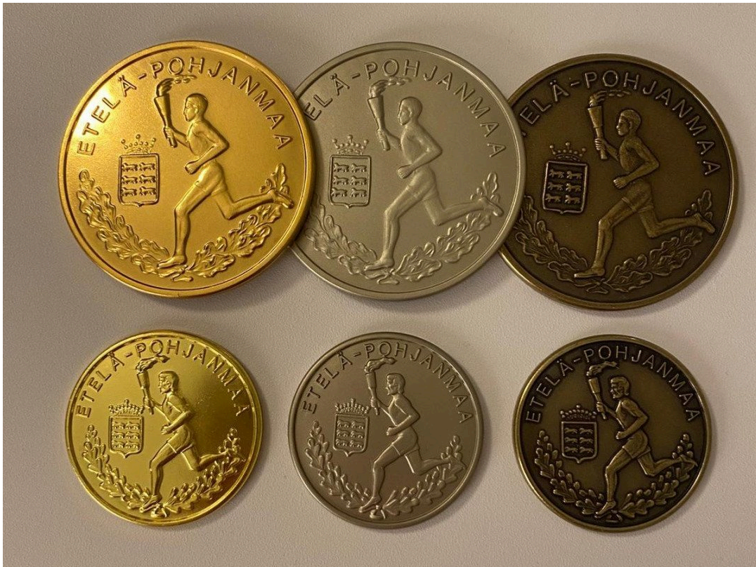
PLU:n piirin- ja aluemestaruusmitalit.